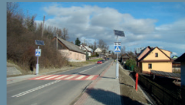
znak drogowy aktywny D-6